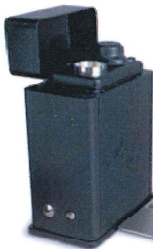
Рисунок 1 – Общий вид анализаторов рентгенофлуоресцентных энергодисперсионных модернизированных АДК ПРИЗМА-М