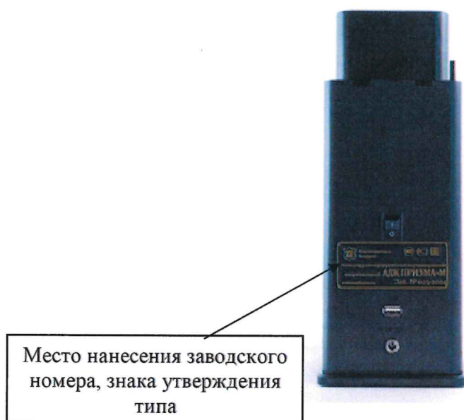
Рисунок 3 – Место нанесения заводского номера, знака утверждения типа на анализаторы